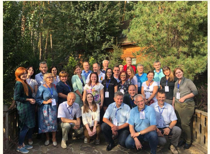
Стратегічна сесія Громадської мережі публічного права та адміністрації UPLAN

Окрім визначення базових позицій спільної діяльності Мережі, учасники стратегічної сесії працювали над проектом робочого плану на 2018-2019 рр. Він включає як проведення публічних заходів, так і роботу над ґрунтовними аналітичними продуктами («білі» та «зелені» книги реформ, моніторинг реалізації законодавчих змін тощо).